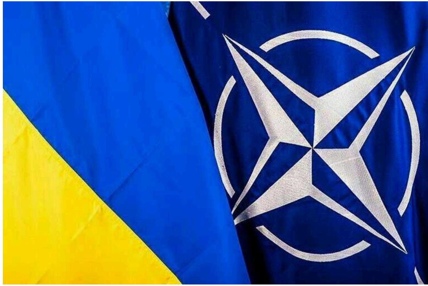
Foreign Policy: Головні противники запрошення України до НАТО – США та Німеччина

Країни Східної Європи та Велика Британія наполягають на запрошенні України до НАТО. США та Німеччина – головні противники.