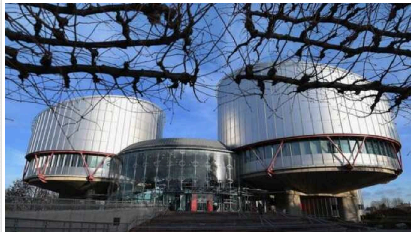
Через відмову у перетині кордону українці подають скарги до ЄСПЛ

На сайті ЄСПЛ з'явилися вже три скарги від чоловіків-українців щодо відмов у пропуску заявників через кордон України. Заявники скаржаться, що обмеження їхнього виїзду за кордон під час воєнного стану було незаконним. І порушувало їхнє право на свободу пересування.