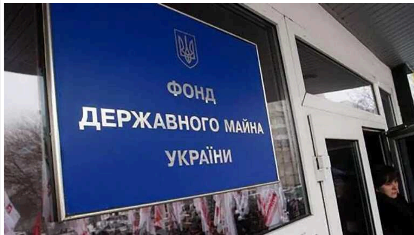
Україна отримала перші кошти від підсанкційних осіб