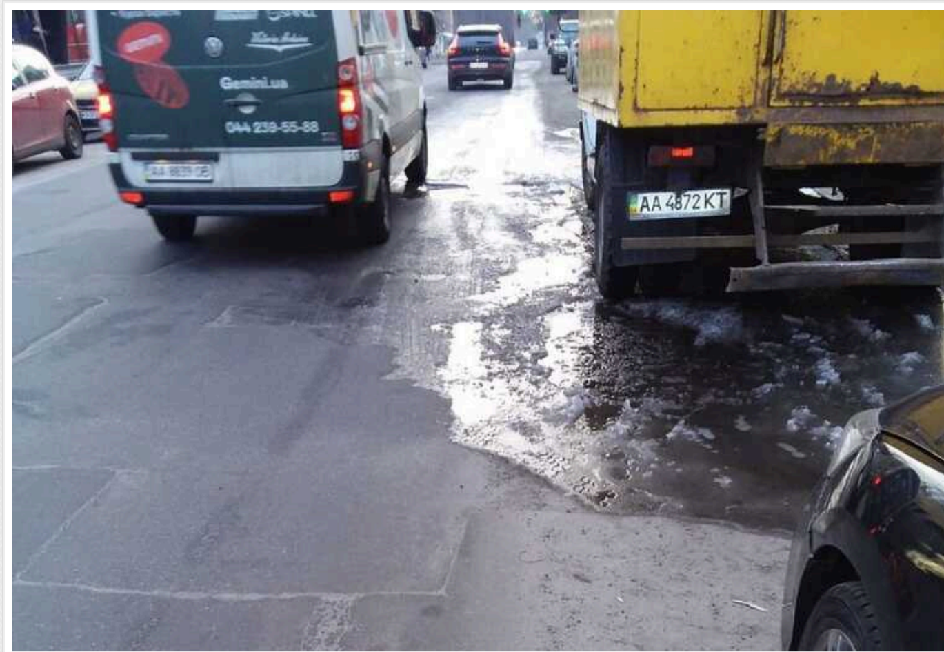
У Києві сталося дві аварії на водопроводах

У Києві вранці 31 січня сталося одразу дві аварії на водопроводах. Без води залишилося 10 будинків, школа та дитячі садки.