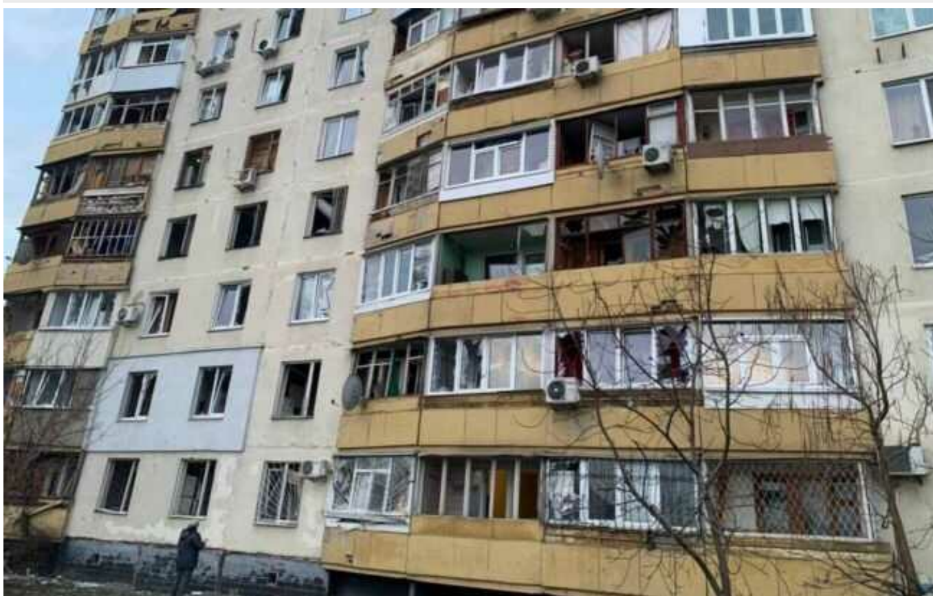
Атака "шахедів" по Харкову: з'явилися ранкові фото та відео наслідків

Внаслідок атаки РФ по житлових кварталах Харкова пізно ввечері 30 січня сталося кілька пожеж у Слобідському та Салтівському районах. Рятувальники ліквідували наслідки ворожої атаки безпілотників.