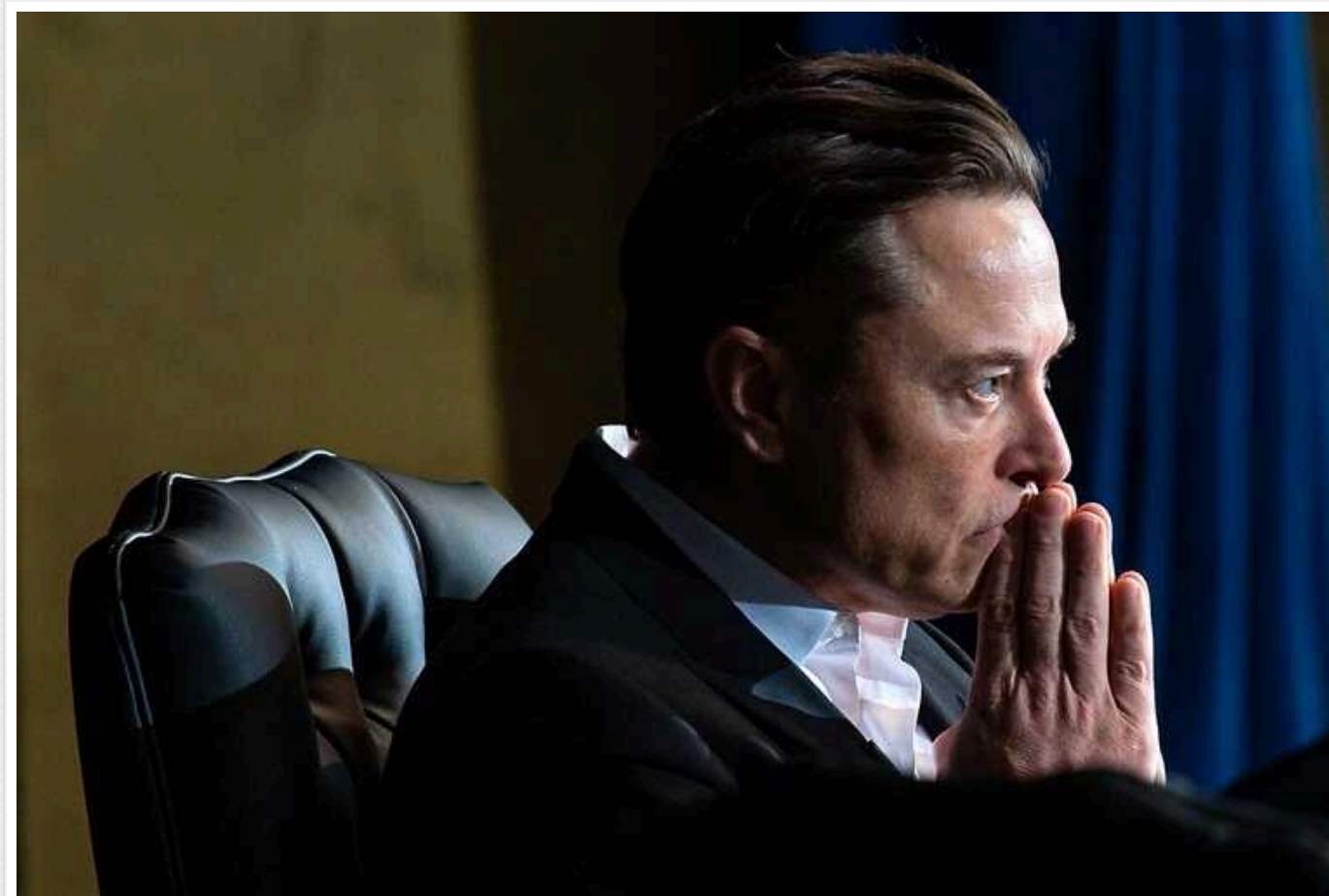
Американський суд ухвалив рішення не виплачувати Ілону Маску багатомільярдну компенсацію від Tesla

Суд штату Делавер у США ухвалив рішення, яке заборонє виплачувати голові компанії Tesla Ілону Маску його "зарплатну компенсацію". Йдеться про суму в 56 мільярдів доларів.