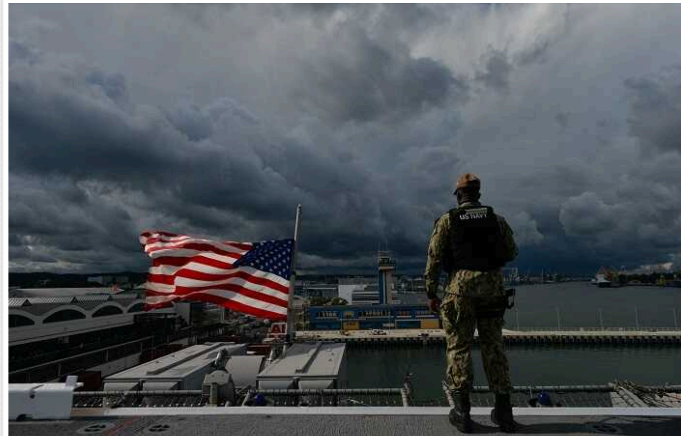
Найбільші навчання НАТО Steadfast Defender розпочнуться сьогодні

Сьогодні розпочинаються найбільші навчання НАТО Steadfast Defender з часів Холодної війни. Вони проходять неподалік кордонів Росії.