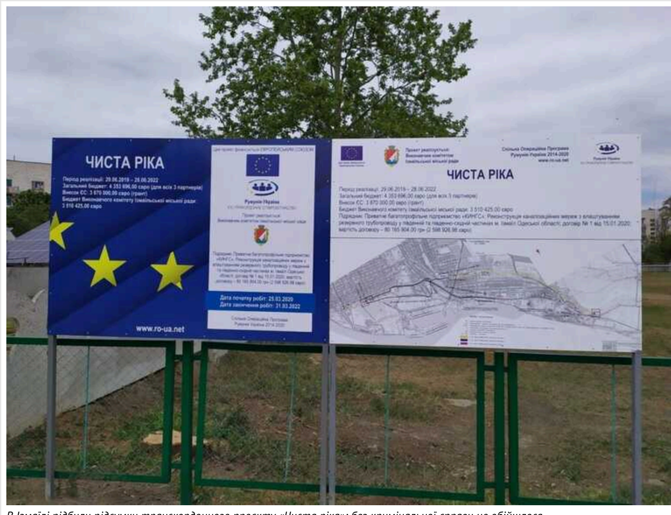
В Ізмаїлі підбили підсумки транскордонного проєкту «Чиста ріка»: без кримінальної справи не обійшлося

28 грудня 2023 року в місті Ізмаїл Одеської області, завершився інфраструктурний транскордонний проєкт «Чиста ріка». Його, за кошти Європейського Союзу, реалізували з 2019 року Ізмаїльський міськвиконком, а також румунські партнери – Асоціація «Єврорегіон «Нижній Дунай» та Повітова рада Тульча.