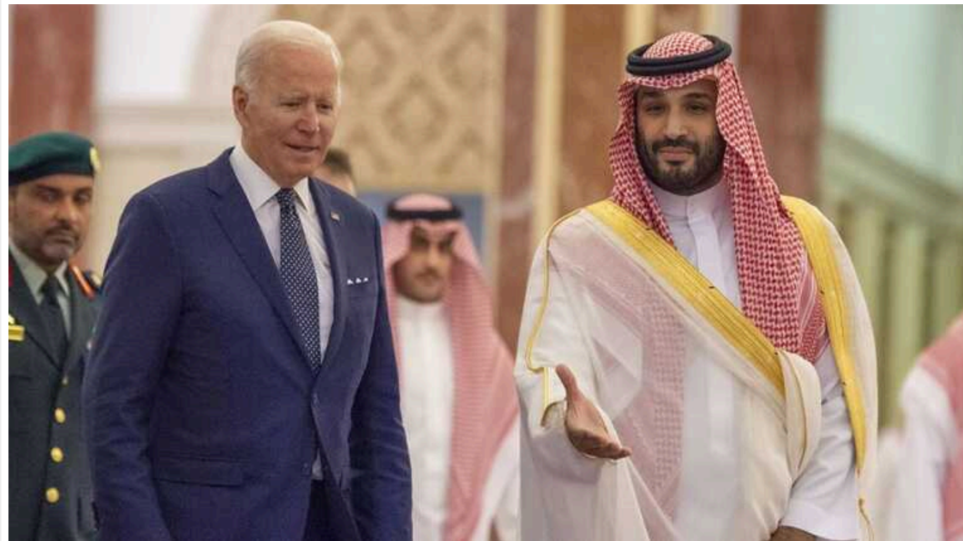
Саудівська Аравія відновила переговори про оборонну співпрацю зі США

Саудівська Аравія відновила переговори зі Сполученими Штатами щодо налагодження тісніших оборонних зв'язків. Діалог було припинено через початок війни між Ізраїлем та ХАМАСом у жовтні минулого року.