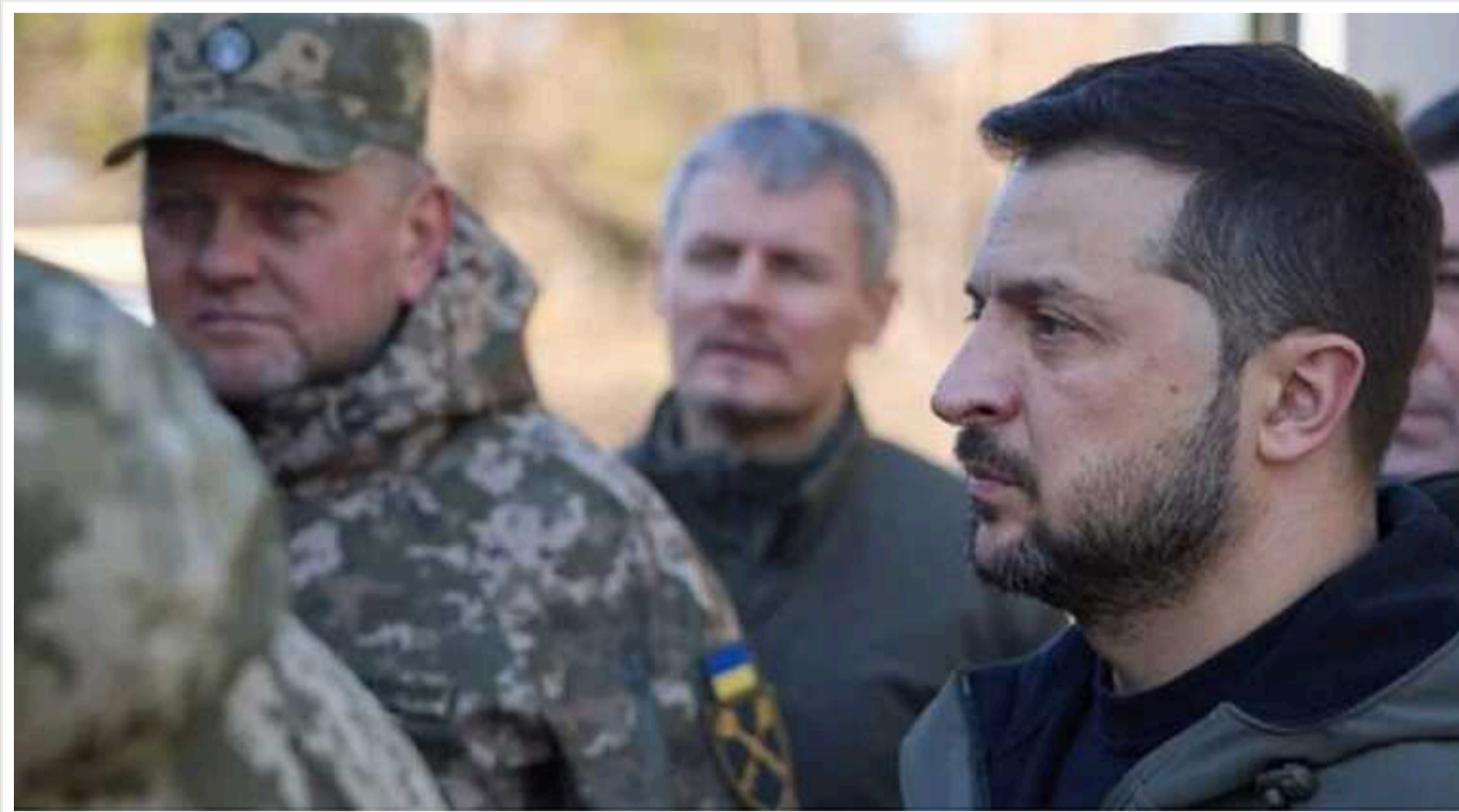
The Economist: Зеленський вже ухвалив рішення звільнити Залужного, але Буданов в останній момент відмовився від посади

The Economist стверджує, що відставку Головнокомандувача ЗСУ відстрочив розголос у пресі та раптова зміна настрою начальника ГУР.