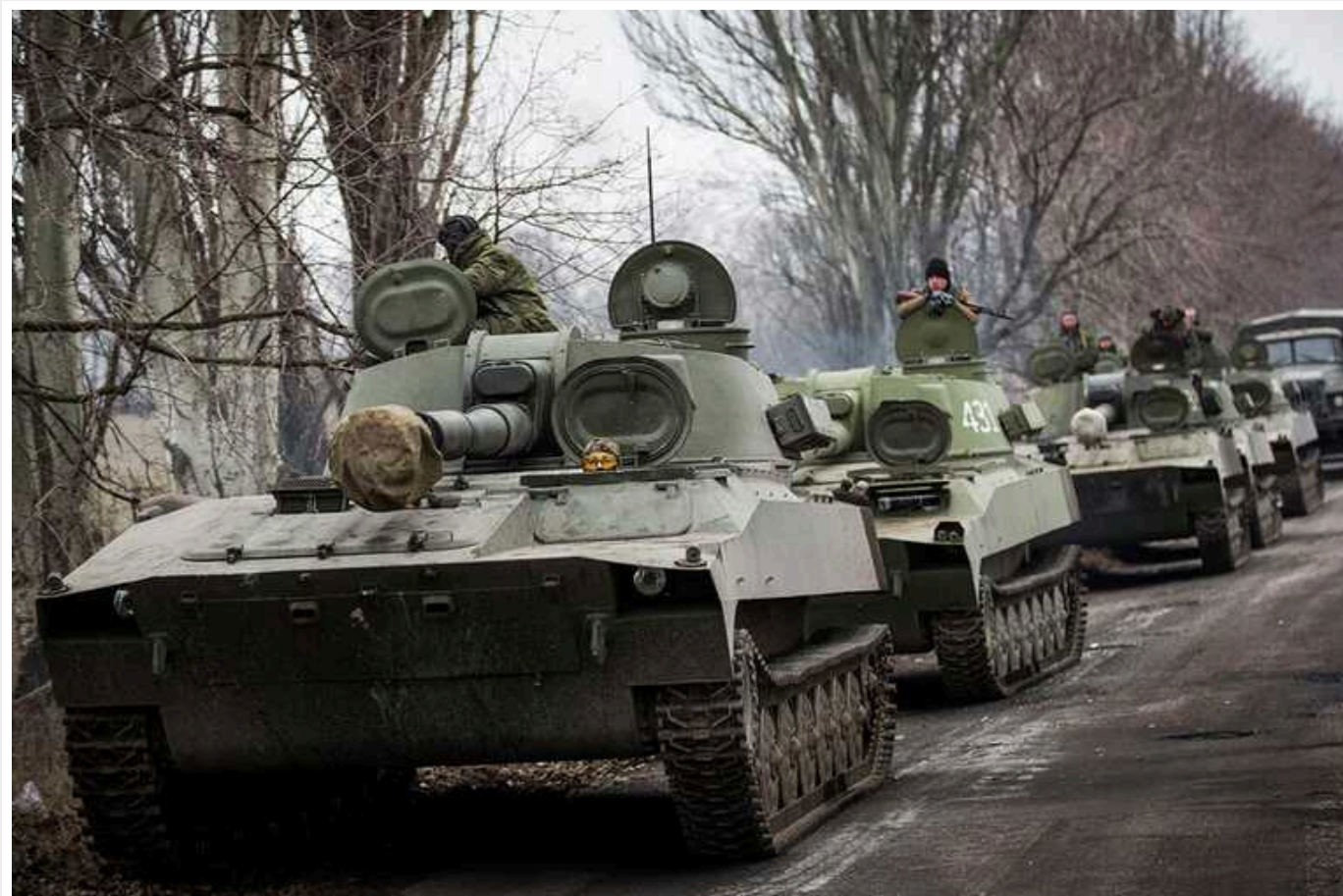
РФ може виробляти не менше сотні танків на місяць, – ISW

За даними Міністерства оборони Великої Британії, російська оборонно-промислова база може виробляти щонайменше 100 основних бойових танків на місяць. Це дозволить агресору замінити втрати на полі бою, а російським військам продовжувати свої нинішні темпи операцій "в найближчому майбутньому".