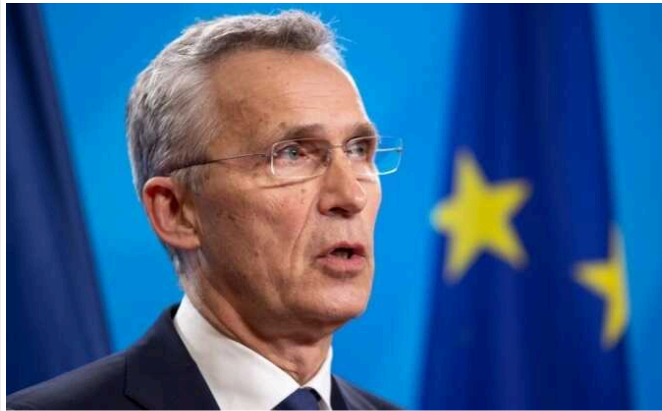
Генсек НАТО Столтенберг обговорив з керівництвом Конгресу США фіндопомогу Україні

Генеральний секретар Альянсу Єнс Столтенберг у вівторок, 30 січня 2024 року, зустрівся зі спікером Палати представників США Майком Джонсоном та іншими керівниками Конгресу у Вашингтоні, округ Колумбія.