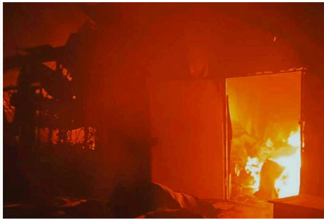
Сили оборони Півдня показали фото наслідків ворожої атаки БПЛА

Вночі ворог знову вдався до дронного терору південних регіонів. В зоні відповідальності Сил оборони півдня України підрозділами ППО збито 7 БПЛА типу Shahed-131/136: 5 на Миколаївщині і 2 на Кіровоградщині.