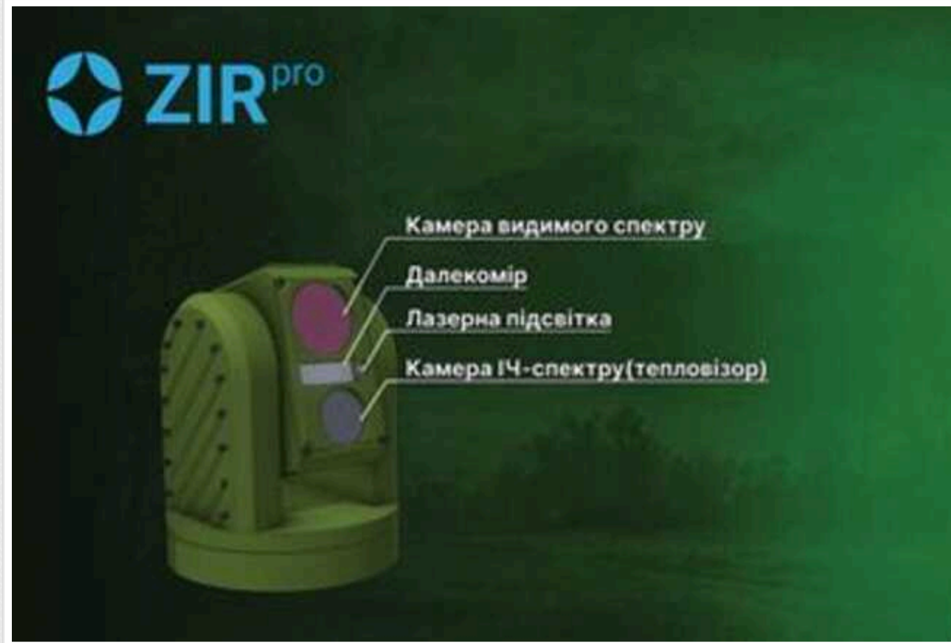
В Україні створили інноваційний комплекс тепловізійного спостереження – "ЗІР Про"

Повномасштабне вторгнення створило нові запити від військових щодо цілодобового дистанційного спостереження, контролю та охорони місцевості, периметрів та шляхів пересування рухомих об'єктів, на які оперативно відреагували київські розробники.