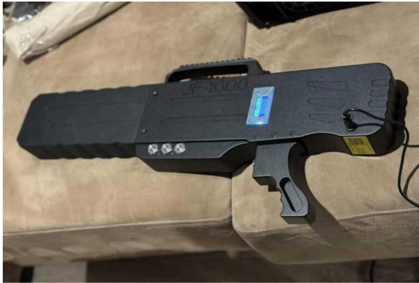
Компанія «Антидрон Україна» створила нову рушницю для боротьби з FPV-дронами, вона покриває всі діапазони радіочастот

Система може ефективно працювати на відстані 500 метрів, покриваючи всі діапазони радіочастот, які використовують російські військові. Нова рушниця C-Vog FPV Hunter, для боротьби з ударними FPV окупантів покриває максимально діапазони використовувані ворогом. Ефективна відстань – 500+м », – написали розробники.