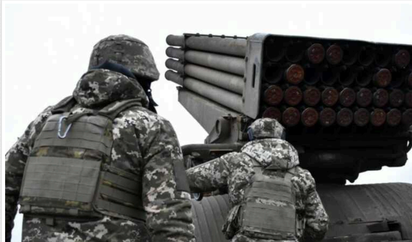
У Верховній Раді можуть дозволити зберігати біоматеріал загиблих військових

Автори опублікованого документа заявляють, що ухвалення законопроекту дасть змогу врегулювати питання соціального захисту військовослужбовців. Після закінчення терміну витрати за зберігання можуть узяти на себе особи, яких вказав у розпорядженні загиблий боєць.