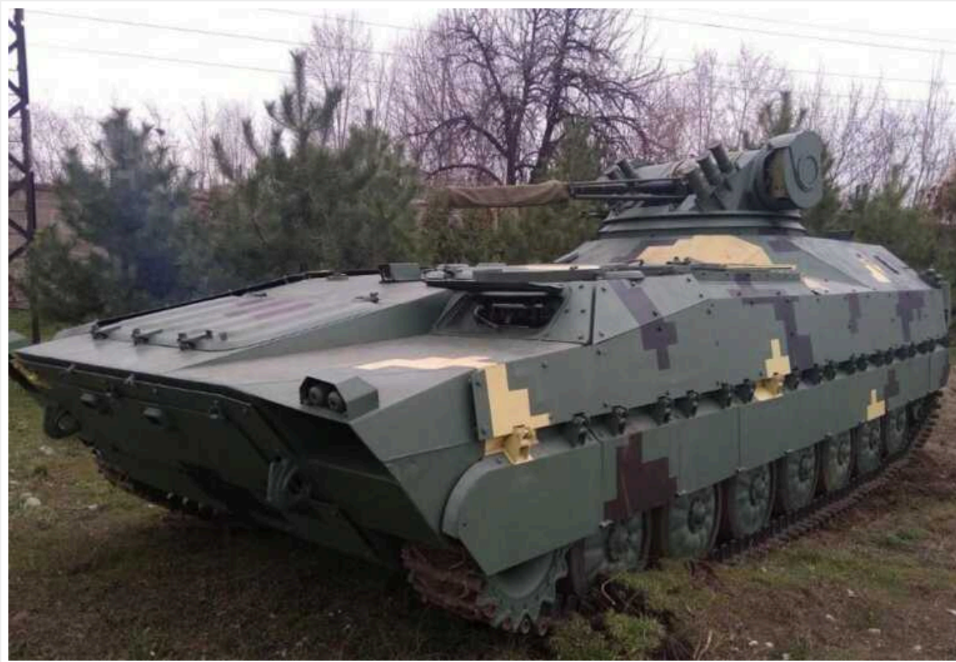
В Україні створили бойову машину піхоти «Кевлар-Е» із бойовим модулем «Штурм» і 30-мм автоматичною гарматою

Бойова машина «Кевлар-Е», розроблена в КБ компанії «УкрІнМаш», призначена для транспортування особового складу механізованих підрозділів сухопутних військ та їх вогневої підтримки в бою, знищення сучасних бойових броньованих та неброньованих машин, низько літаючих нешвидкісних повітряних цілей, морських цілей при діях у береговій смузі, інших наземних цілей на дальності до 5000 метрів.