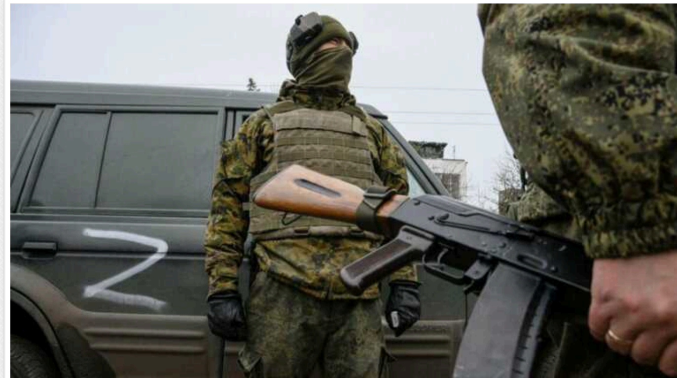
На Херсонщині в окупованих Олешках загарбники розстріляли цивільного чоловіка, який вийшов покурити

За свідченнями очевидців, група нетверезих озброєних окупантів роззулювала в Олешках, і в якийсь момент вони почали хаотичну стрілянину по подвір'ях місцевих жителів.