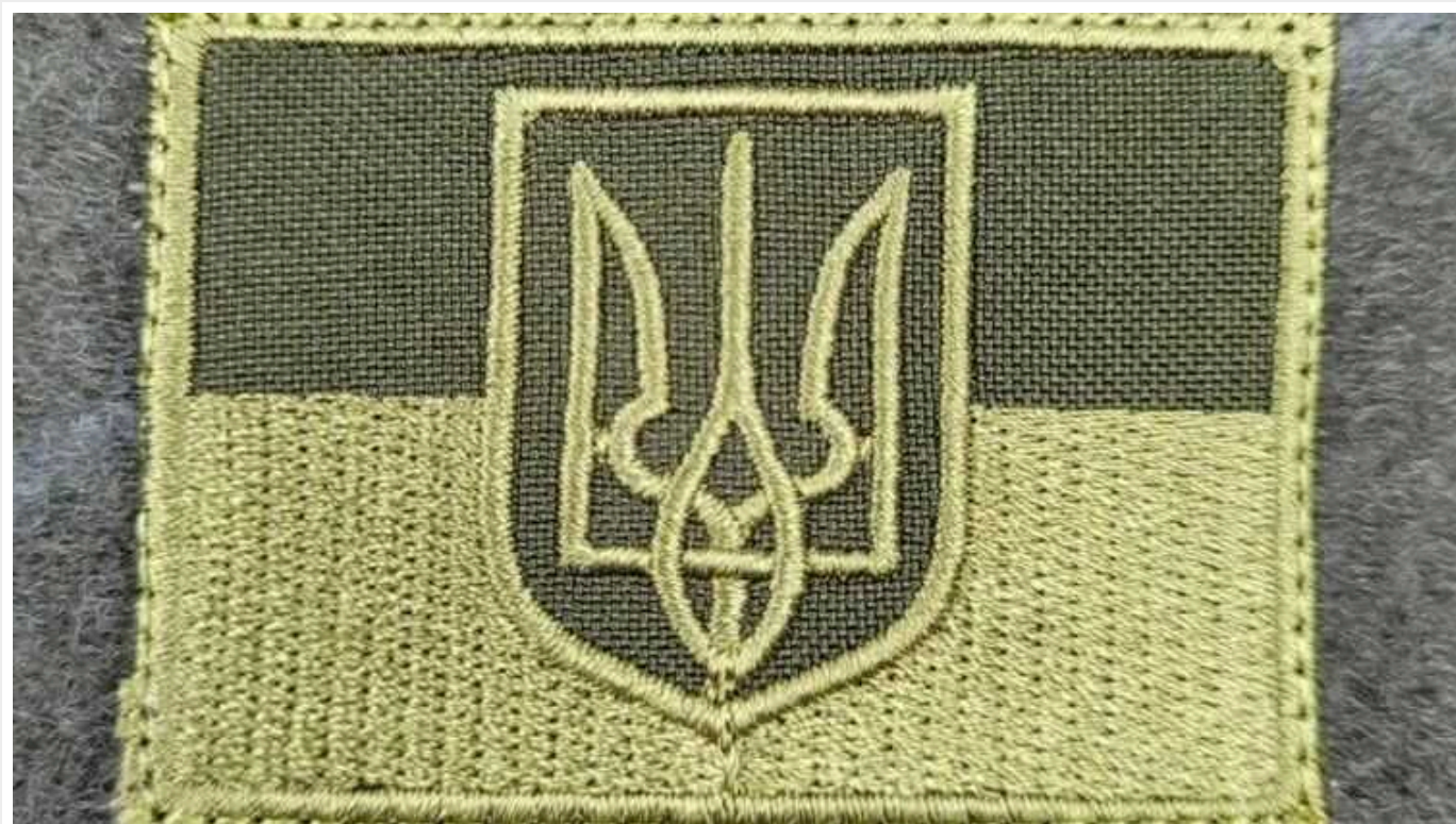
Хто з українців не підлягатиме призову щодо нового законопроекту про мобілізацію

Стало відомо, хто з громадян України не підлягатиме заклику щодо нового законопроекту про мобілізацію: