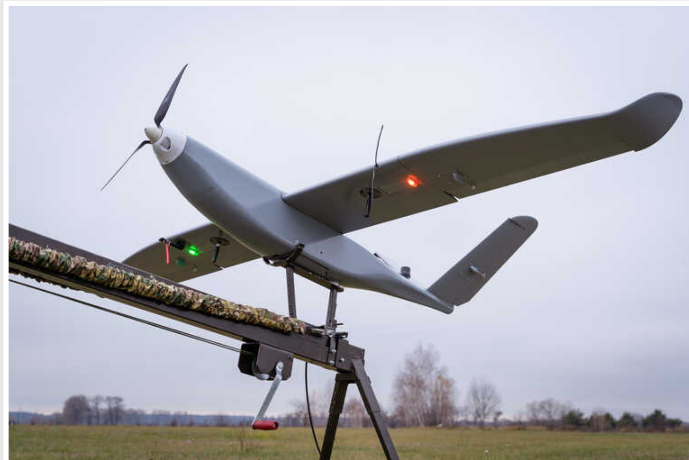
Український БПЛА «Гор» піднімається на висоту до 3,5 кілометрів, знищуючи артилерію та системи РЕБ окупантів

У зоні бойових дій безпілотний літальний апарат «Гор» здійснив понад 70 бойових вильотів, допомагаючи українським військовим знищувати війська та техніку окупантів, про це розповів керівник української компанії-виробника Airlogix.