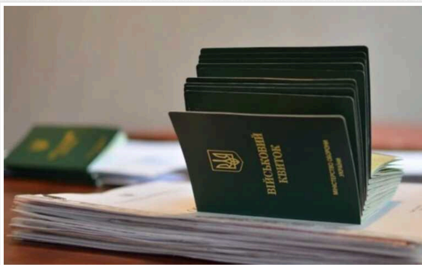
Як переписали законопроект щодо мобілізації: електронні повістки, блокування рахунків, перегляд білих квитків

До Верховної Ради внесли новий законопроект щодо посилення мобілізації, його текст з'явився на сайті парламенту.