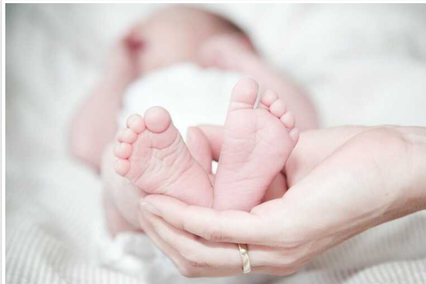
Народжуваність в Україні стрімко падає, – The Times

Про це повідомляється з посиланням на директора Інституту демографії та соціальних досліджень Національної академії наук України.