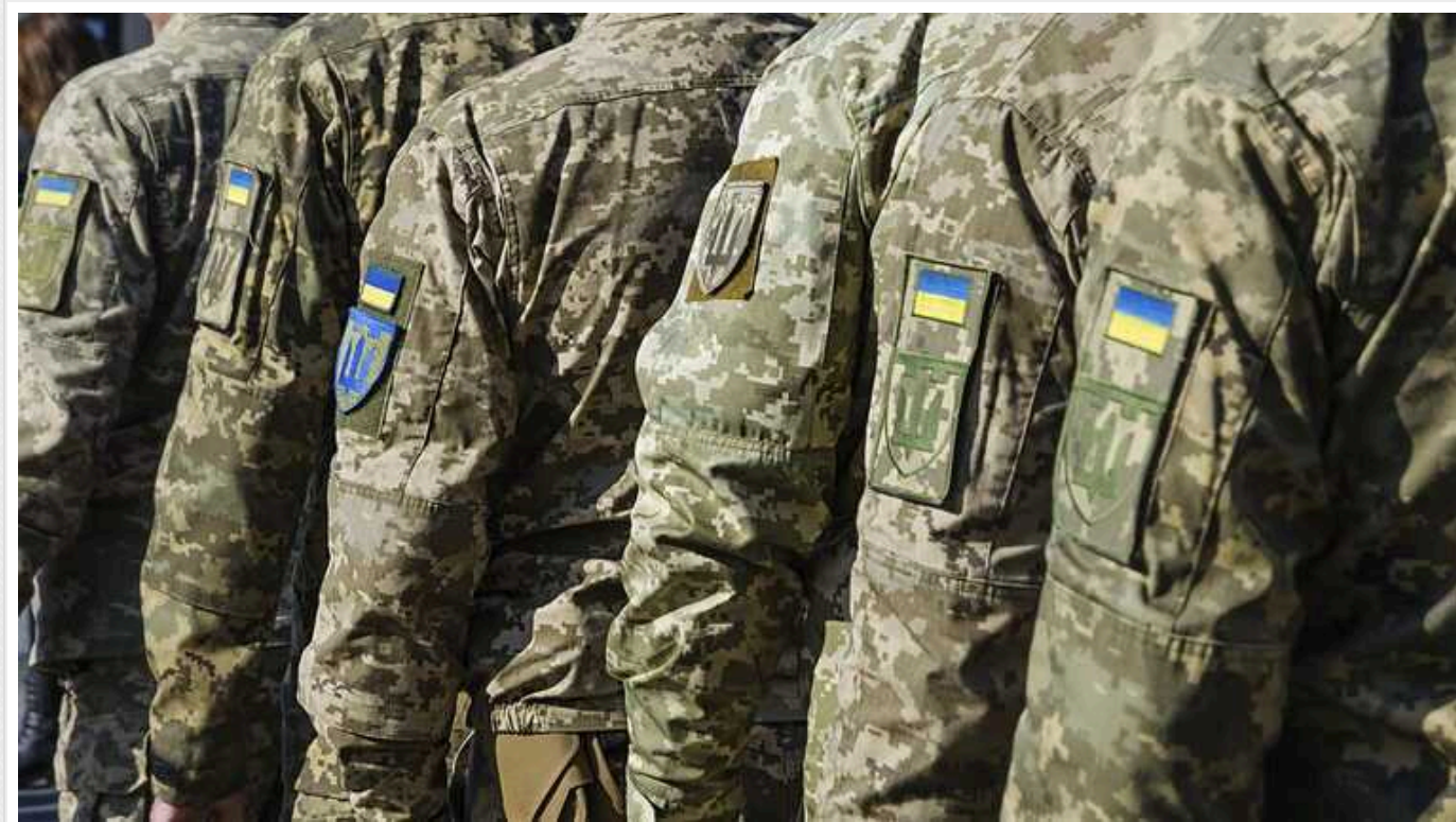
Новий законопроект про мобілізацію вказує поважні причини не прийти до ТЦК у строки, визначені повісткою