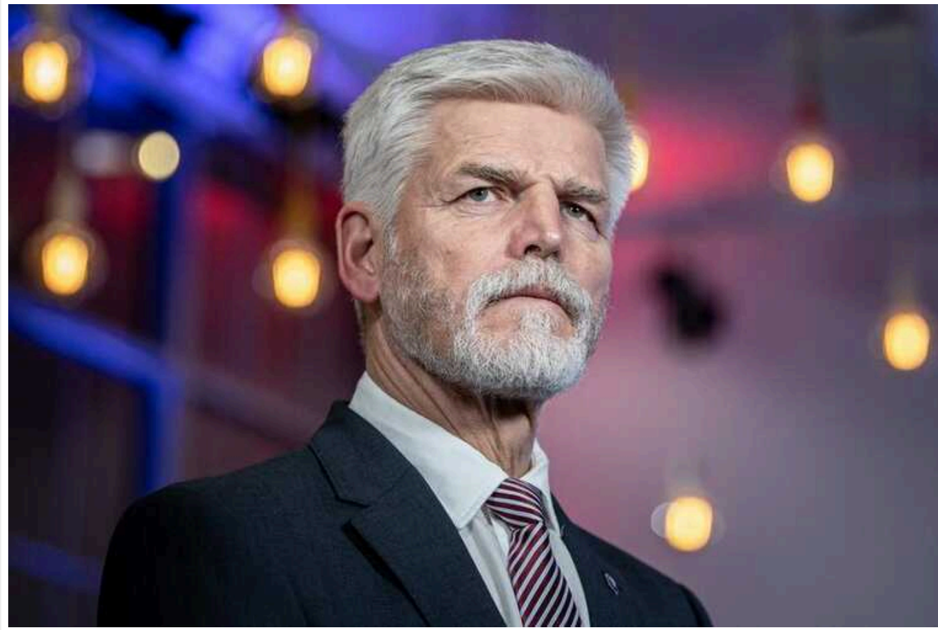
Європа має бути готова до перемоги Дональда Трампа та її наслідків, – президент Чехії Павел

Президент Чехії Петр Павел заявив, що Європа повинна готуватися до можливості перемоги на президентських виборах у США колишнього глави держави Дональда Трампа. Це може мати досить негативні наслідки як для Європи, так і для України.