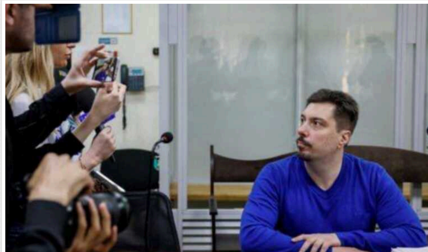
Ексголови Верховного суду Князєву в черговий раз зменшили розмір застави

Вищий антикорупційний суд зменшив розмір застави колишньому голові Верховного Суду Всеволоду Князєву.