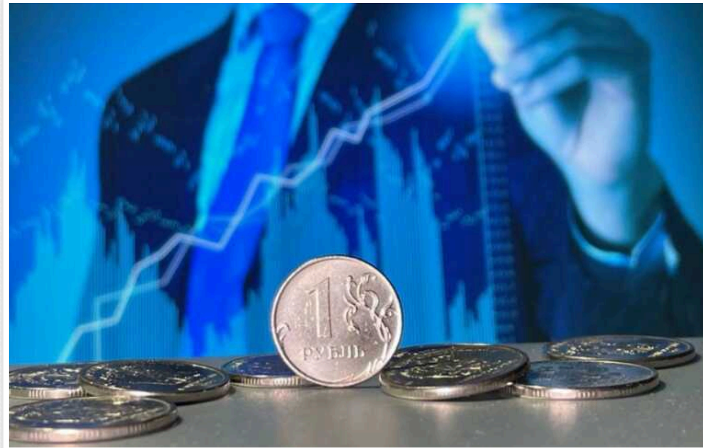
Війна проти України стала наркотиком для економіки РФ, - WIIW

Розіріта війною проти України російська економіка працює на межі своїх можливостей та демонструє дедалі більші ознаки перегріву. Відповідно, вона більше не зможе продовжувати своє стрімке зростання. При цьому сама Росія дедалі більше залежить від продовження війни, витрати на яку діють на її економіку як наркотик.