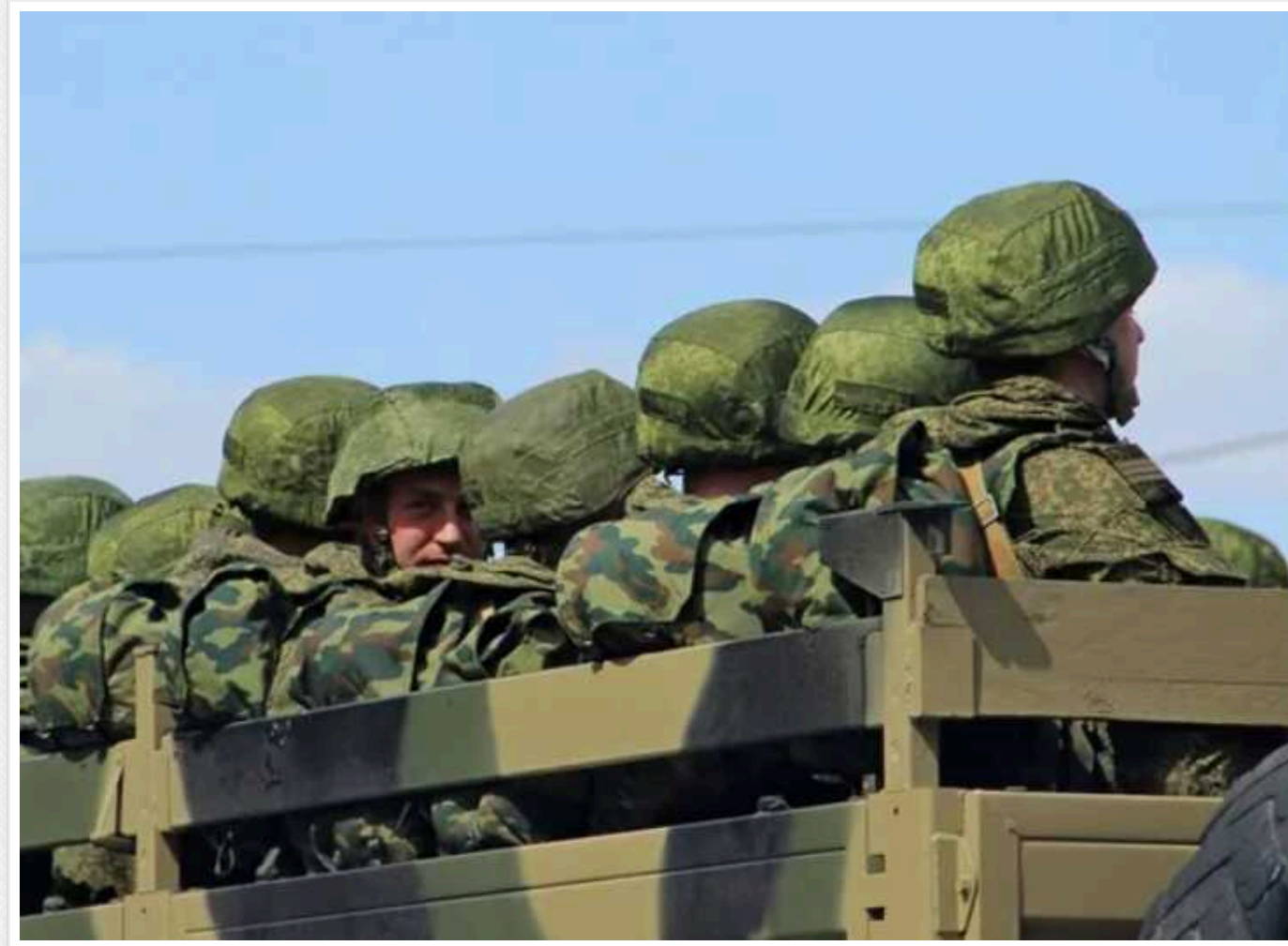
"Списують" заднім числом: У ЗС РФ мобілізують хворих на СНІД і туберкульоз

У Росії в армію мобілізують з будь-яким захворюванням, навіть хворих на гепатит, СНІД, з онкологією і туберкульозом. Проте якщо такі "воїни" залишаються в живих, їх "списують" заднім числом та без грошей.