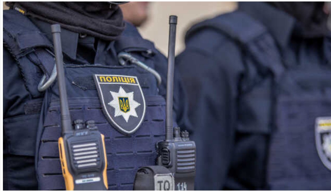
Новий законопроект про мобілізацію: до оповіщення військовозобов'язаних залучать поліцію

Також поліцейським дають право адміністративного затримання та доставки до ТЦК ухлянтів.