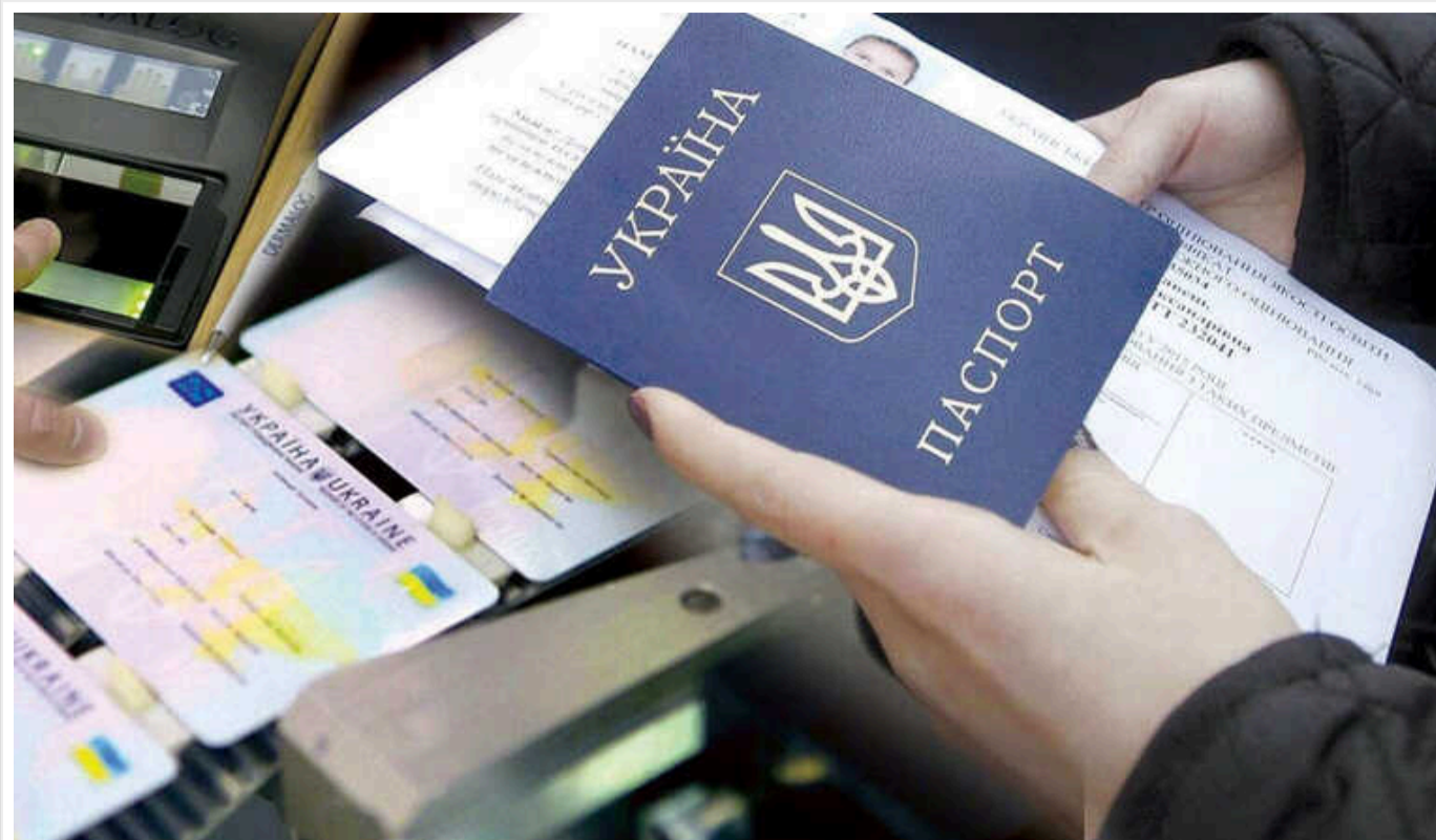
Консульські дії за кордоном для чоловіків віком від 18 до 60 років здійснюватимуться лише за умови наявності у них військово-облікових документів

Оформлення паспорта громадянина України, закордонного паспорта громадянина України здійснюватиметься за умови наявності військово-облікових документів.