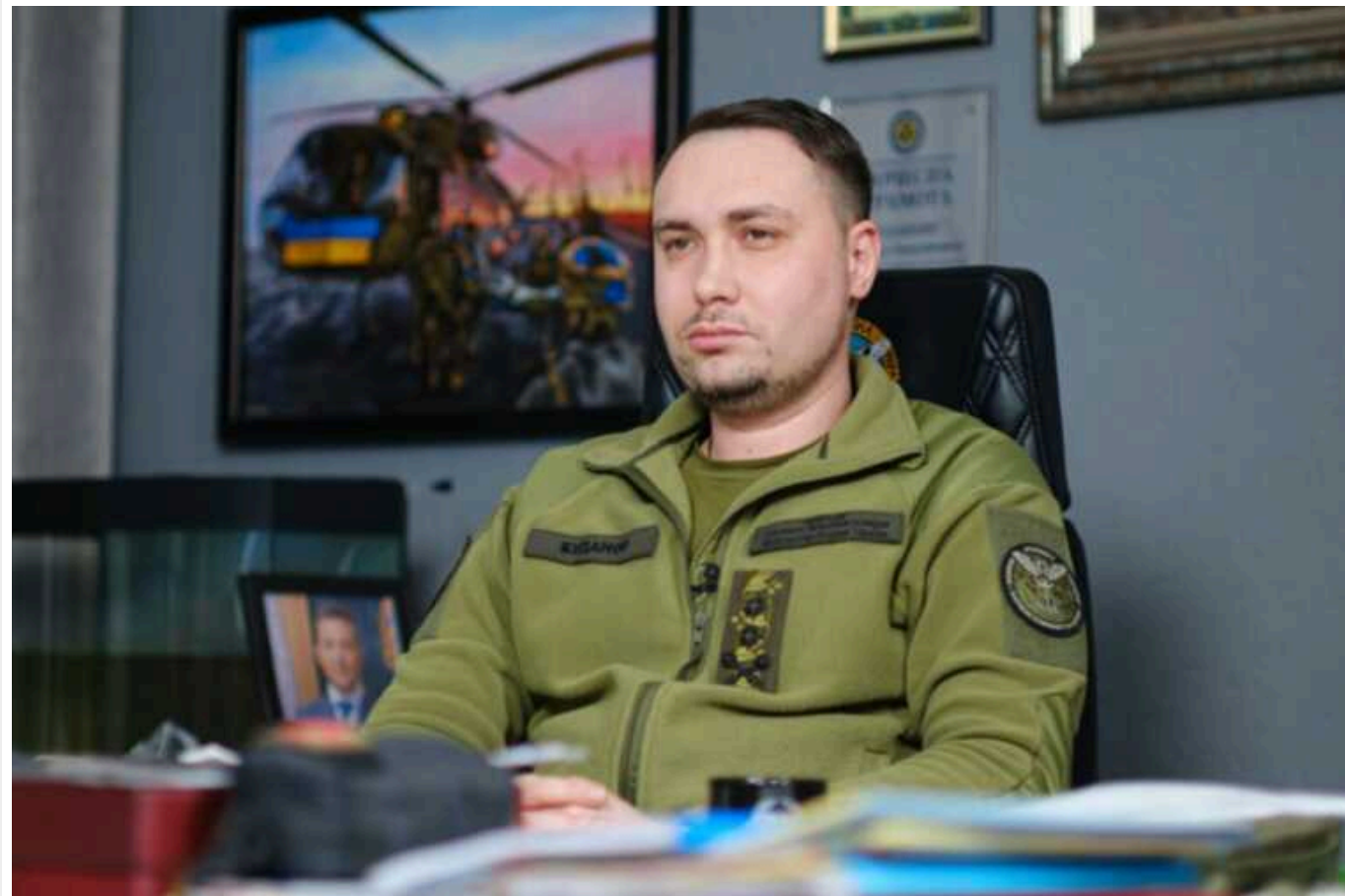
Це буде болісним для Путіна, але напад його не схопить, – Буданов про знищення Кримського мосту

Керівник української військової розвідки Кирило Буданов сподівається, що незаконно збудований російськими окупантами Кримський міст буде ліквідований вже цього року.