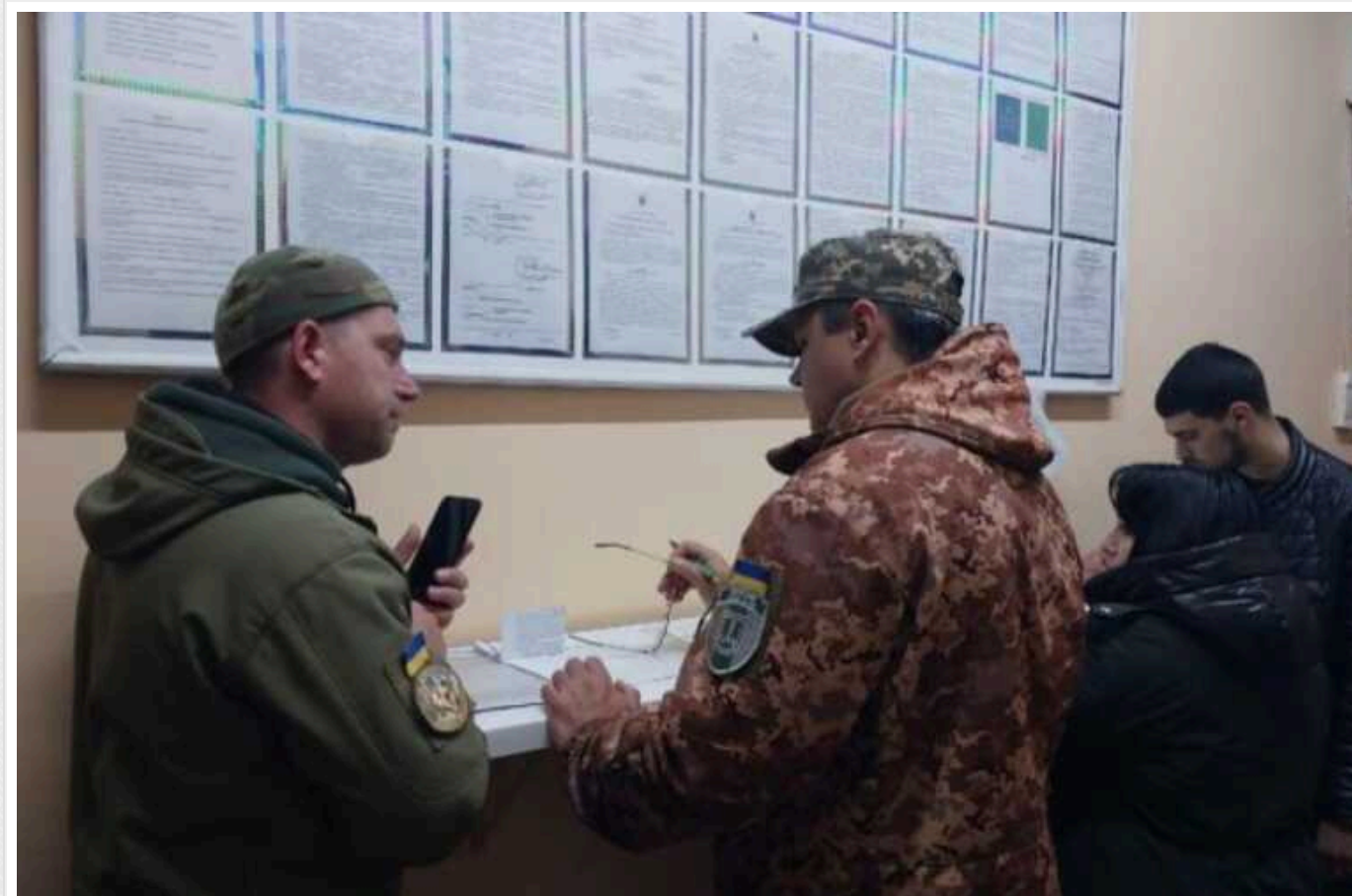
Українцям хочуть надсилати повістки до військкомату через електронний кабінет

Повістки для мобілізації на військову службу українцям хочуть вручати в новий спосіб, а саме через електронний кабінет.