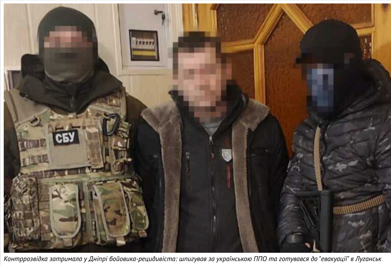
Контррозвідка затримала у Дніпрі бойовика-рецидивіста: шпигував за українською ППО та готувався до "евакуації" в Луганськ

Контррозвідка Служби безпеки України затримала в Дніпрі колишнього бойовика терористичної "ЛНР", який за вказівкою ФСБ РФ шпигував за українською ППО та наводив російські ракети на місто. Фігурант уже мав судимість за роботу на "ЛНР", а нині за успішне виконання завдань окупанти обіцяли "евакуувати" його до окупованого Луганська.