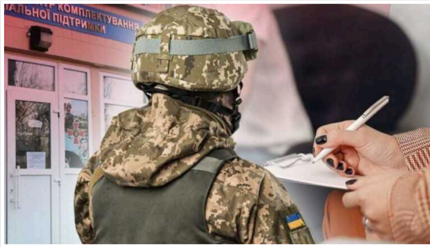
Однією з ключових інновацій у оновленому законопроекті про мобілізацію є введення судових обмежень для осіб, які намагаються ухилитися від призову