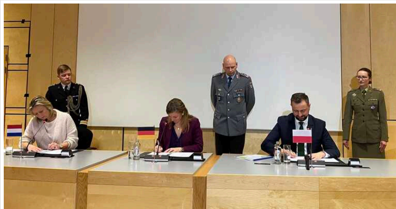
Польща, Німеччина та Нідерланди підписали попередню угоду, спрямовану на скорочення бюрократії, яка перешкоджає швидкому переміщенню військ і зброї на східний фланг НАТО