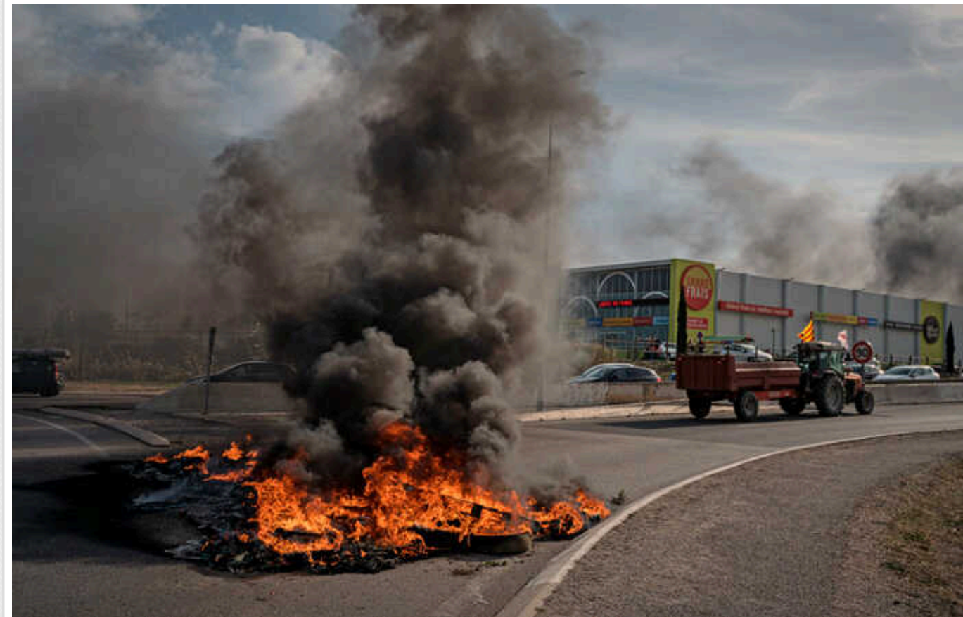
В Іспанії фермери приєднуються до європейських акцій протесту, - Le Monde

Як заявляють профспілки, сільськогосподарський сектор в Іспанії та й у всій Європі стикається з "задушливою бюрократією, породженою нормами ЄС".