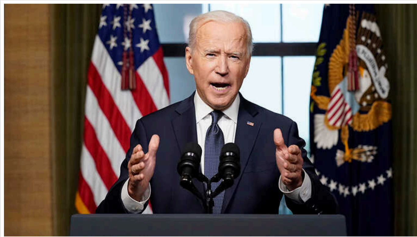
Президент США Джо Байден заявив, що визначився з відповіддю на удар по американській базі в районі Ет-Танф на кордоні Йорданії та Сирії

При цьому він не пояснив, які саме заходи у відповідь можуть вжити США, підкресливши, що Вашингтон не прагне розширення конфлікту на Близькому Сході.