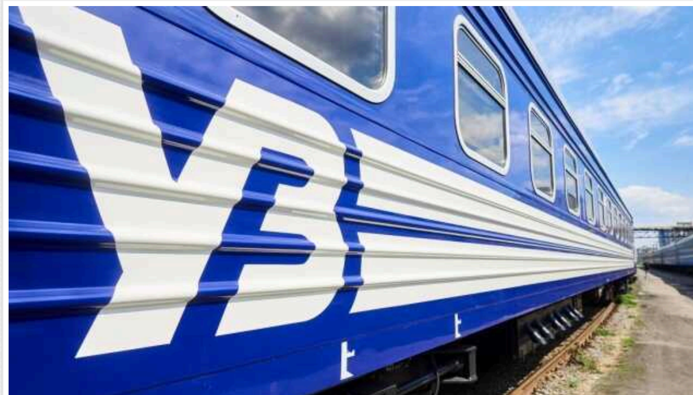
Приватна компанія відшкодувала Укрзалізниці 68 мільйонів гривень збитків

Приватна компанія відшкодувала 80% збитків, завданих АТ «Укрзалізниця» внаслідок вчинення менеджментом цієї компанії злочинних дій упродовж 2016-2020 років. Із серпня 2023 по січень 2024 року на рахунки Укрзалізниці перераховано понад 68 млн грн.