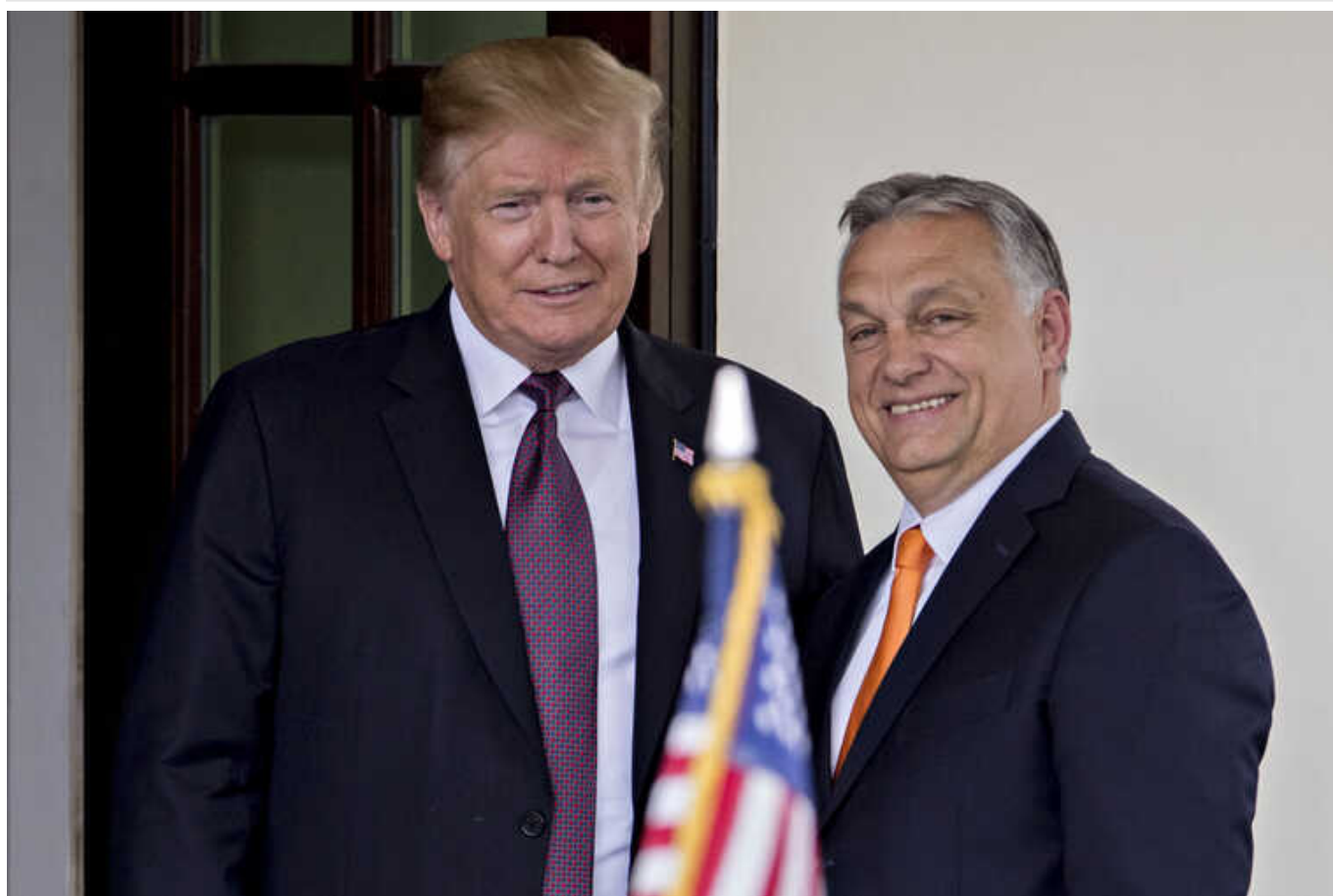
У миру є ім'я – Дональд Трамп, - прем'єр Угорщини Орбан

Угорський прем'єр Віктор Орбан зробив низку компліментарних заяв на адресу колишнього президента США Дональда Трампа, наголосивши на його "миротворчих" якостях.