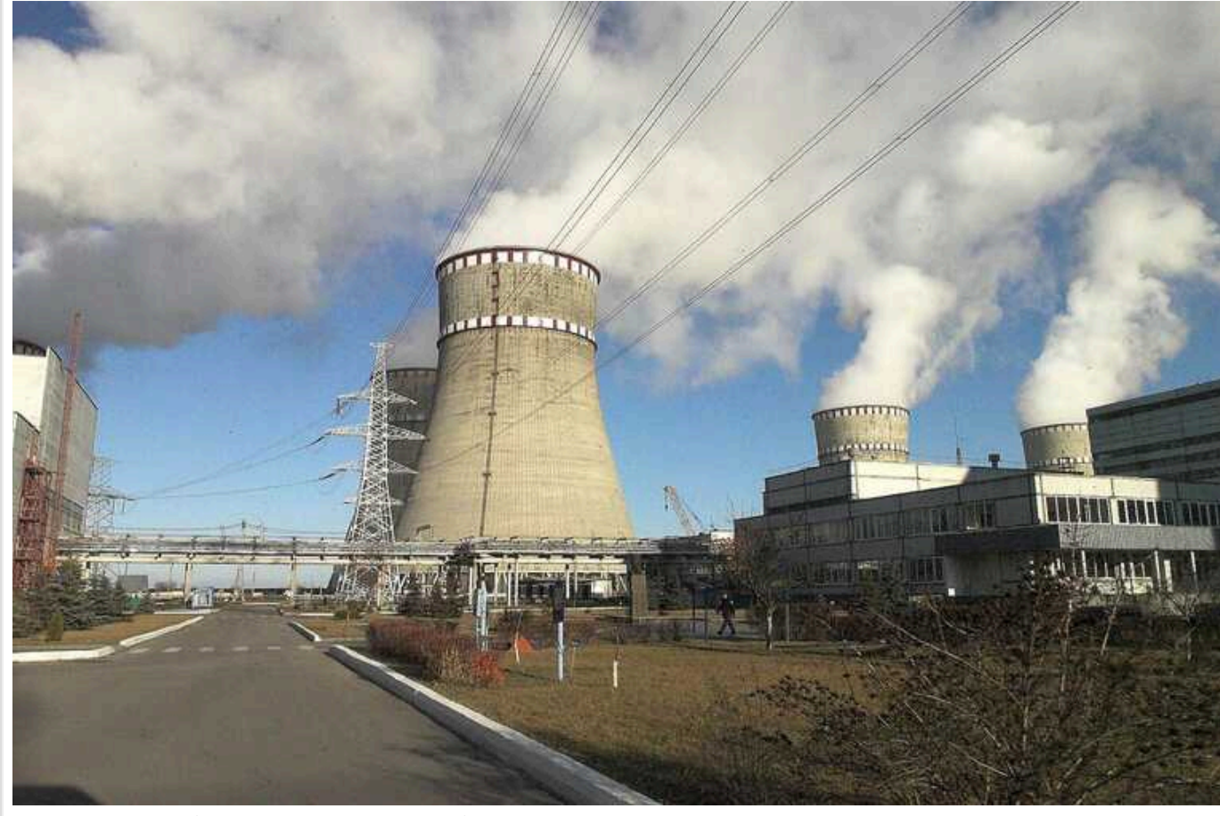
На кого працюють державні виконавці і як вони допомагають країні-агресору зупинити розвиток вітчизняної атомної галузі

Чергове зрощення власних корисливих інтересів за рахунок руйнування стратегічної галузі країни на користь інтересів країни-агресора продемонструвала Державна виконавча служба в особі державного виконавця Олени Фещук.