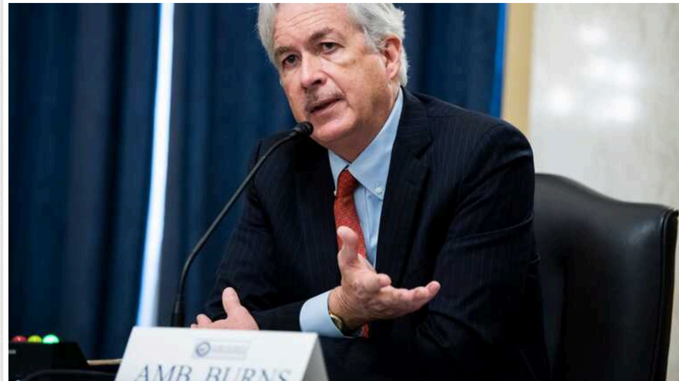
Для України 2024 рік буде важким на фронті, - директор ЦРУ Вільям Бернс

"Цей рік, ймовірно, стане важким на полі бою в Україні, випробуванням на витривалість, наслідки якого вийдуть далеко за межі героїчної боротьби країни за збереження своєї свободи та незалежності", - пише Бернс у колонці Foreign Affairs.