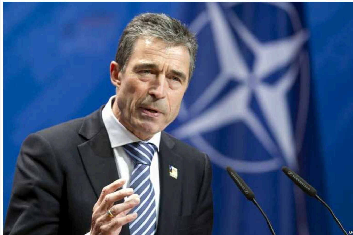
Запрошення Україні в Альянс треба надати на саміті в липні, – Расмуссен

Запрошення України до Північноатлантичного альянсу на саміті у Вашингтоні в липні може позбавити російського диктатора Володимира Путіна стимулу продовжувати війну проти нашої країни та прокласти шлях до миру.