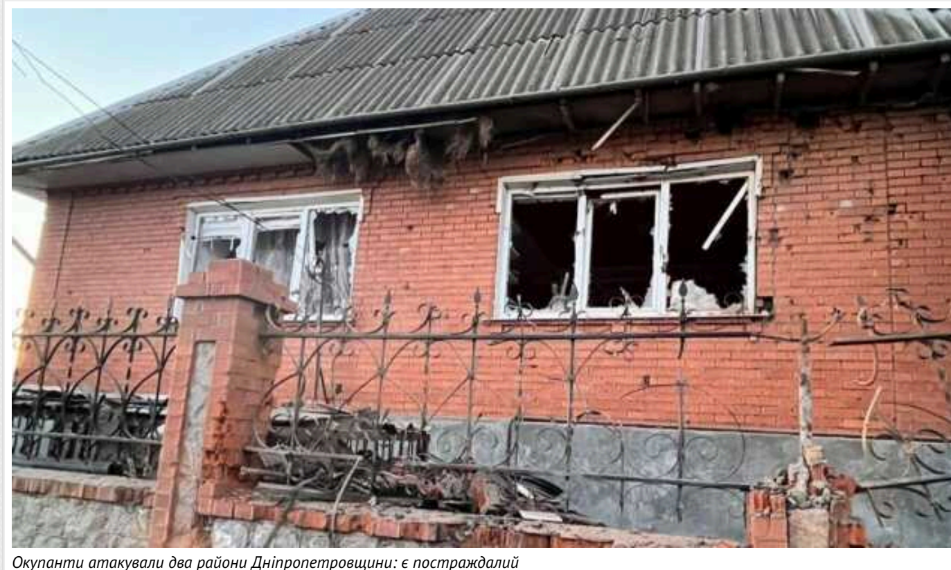
Окупанти атакували два райони Дніпропетровщини: є постраждалий

Ворожа російська армія атакувала Синельниківській та Нікопольський райони. Пошкоджені будинки, постраждала людина.