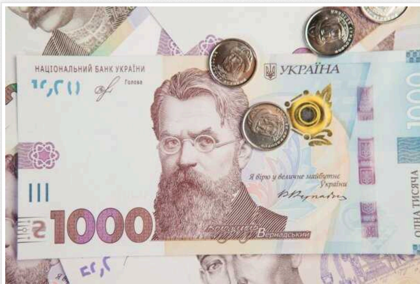
Обсяг гривневої готівки в обігу збільшився і становить 764 мільярди гривень

За 2023 рік сума готівки, що перебувала в обігу в Україні, збільшилася на 48,3 млрд грн.