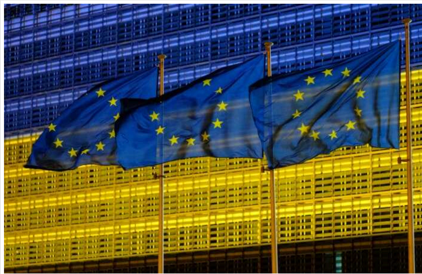
У Єврокомісії заявили, що механізм для передачі Україні доходів від заморожених російських активів наразі не створено

Механізм передачі Україні доходів від заморожених активів РФ наразі не створено.