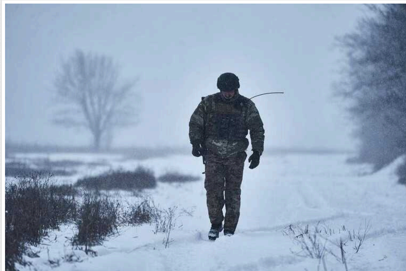
У ЗСУ спростували інформацію про взяття Табаївки у Харківській області: "Не відповідає дійсності"