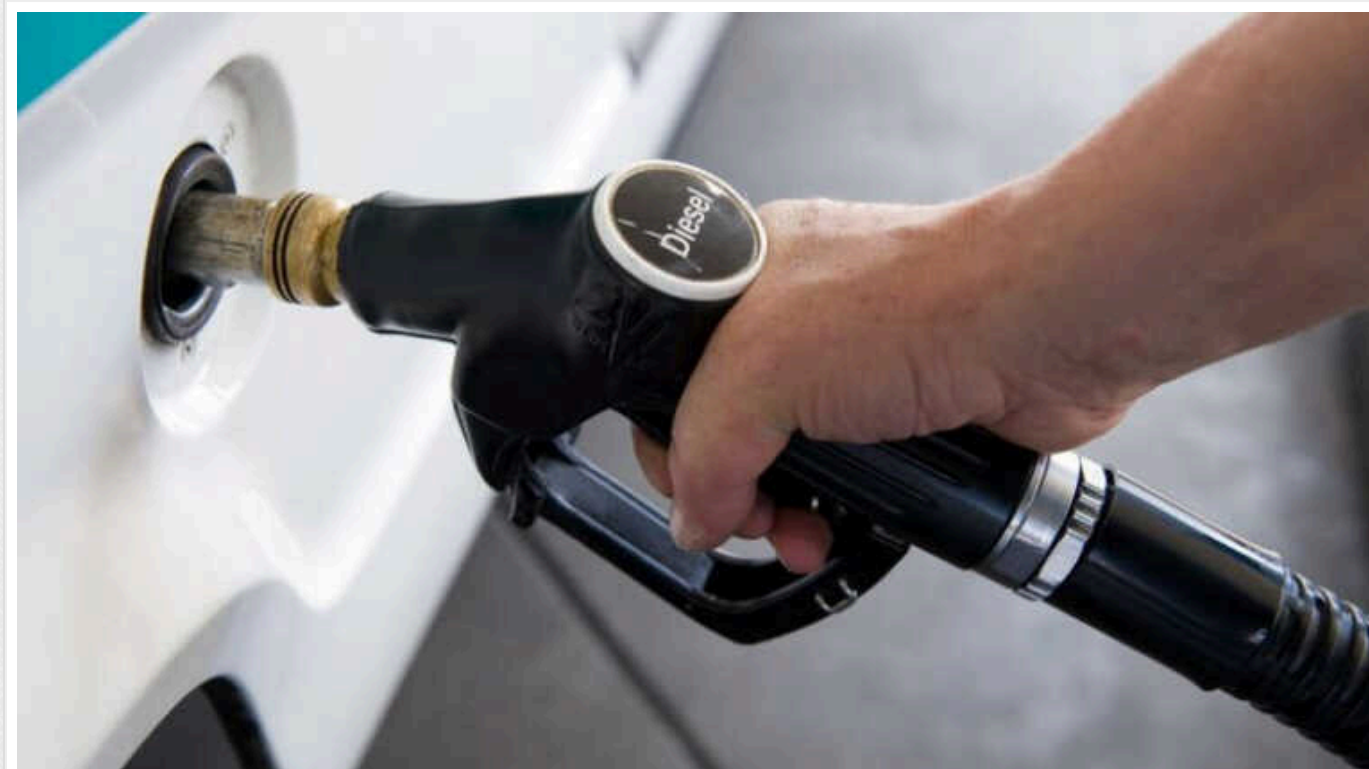
РФ випередила США як найбільшого постачальника дизпального до Бразилії

Бразилія минулого року стала найбільшим покупцем дизельного пального із РФ. Росія випередила США як найбільшого постачальника до Бразилії. Її частка зросла із 50% до 85%.