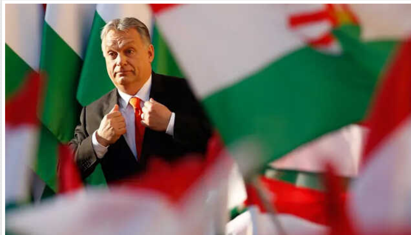
Прем'єр Угорщини обіцяє погодитися на надання Україні 50 мільярдів євро від ЄС, але за однієї умови

Угорщина погодиться на надання Україні допомоги в розмірі 50 млрд євро терміном на чотири роки за умови щорічного перегляду програми.