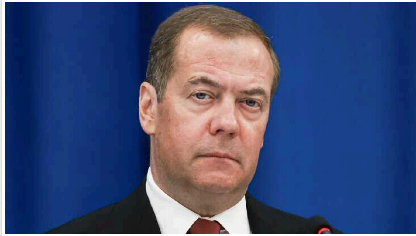
Медведєв "закрив" територіальне питання про Курильські острови: "Плювати я хотів на почуття японців"

Російський політик запропонував невдоволеним тим, що Курильські острови контролює Москва, вчинити самогубство.