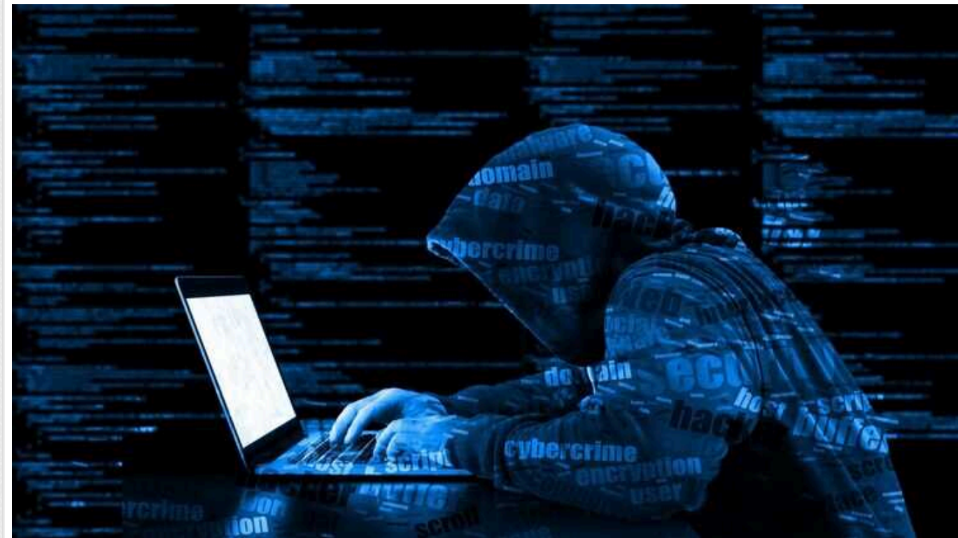
Сайт Мінагрополітики все ще не відновив своєї роботи після кібератаки

Сайт Міністерства аграрної політики та продовольства України зазнав кібератаки, внаслідок чого він зараз недоступний для користувачів.