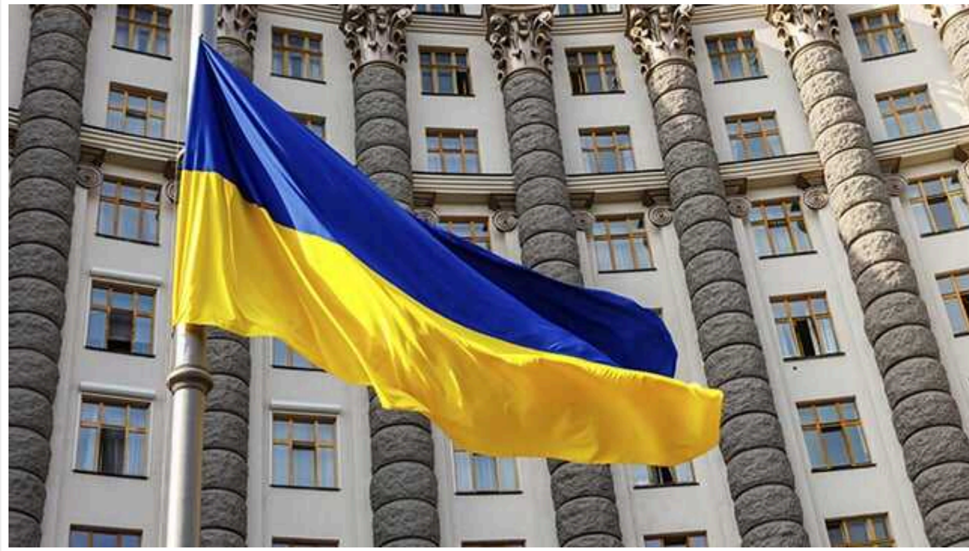
Кабінет Міністрів відреагував на повідомлення про можливе підвищення тарифів на світло у два рази

Кажуть, найближчого місяця цього не станеться.